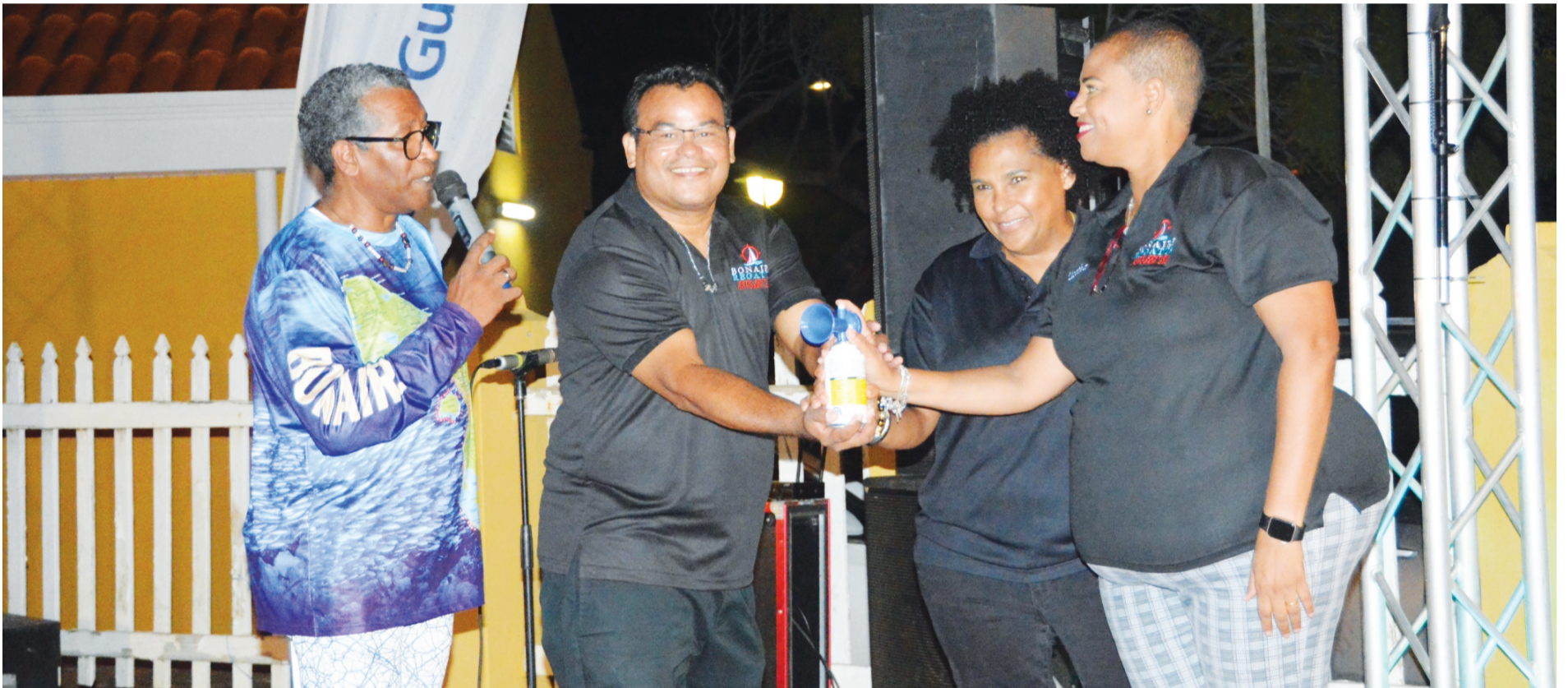
Boneiru ta den gara di Regata. Djabièrnè anochi, 6 di òktober a tuma lugá apertura di Regata 2023, e parti di pustamentu di botonan. Foto ta mustra momentu ku pitu a zona pa marka inisio di e evento.